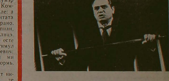
«Ын ИМАЖИНЕ: сменэ дин спектаклоу «Край де Куртэ-Векэ»